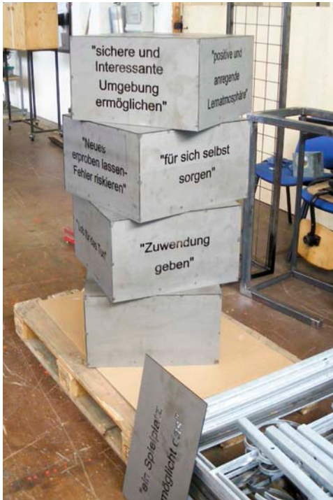
In der Werkstatt stapeln sich die fertigen Quader.