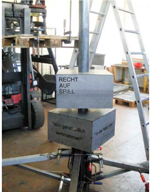
Der zweite Quader ist an seinem Platz.