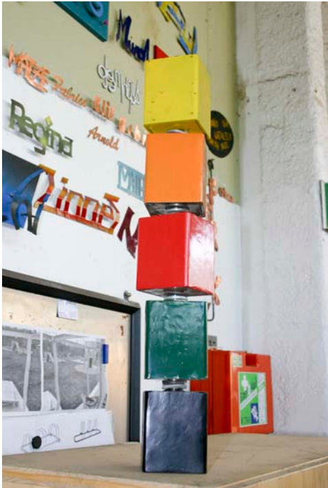
Das von den Jugendlichen erstellte Modell für die Kinderrechte-Skulptur.