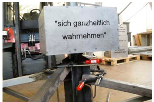
In der Werkstatt wird der Turm aufgebaut, damit später auf dem Spielplatz alles passt.