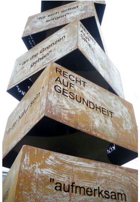
...auf dem Spielplatz in der Achsiedlung in Bregenz erfolgt.