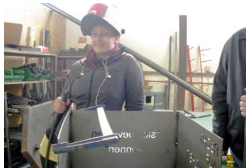
In voller Montur geht es an die Sache.