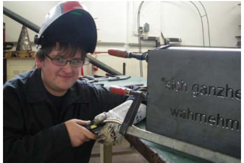
Die vorbereiteten Teile werden in der Werkstatt zusammengeschweißt.