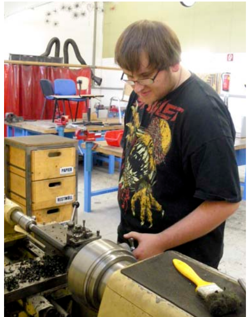
Auch die haus eigene Drehbank kommt in diesem Projekt zum Einsatz.