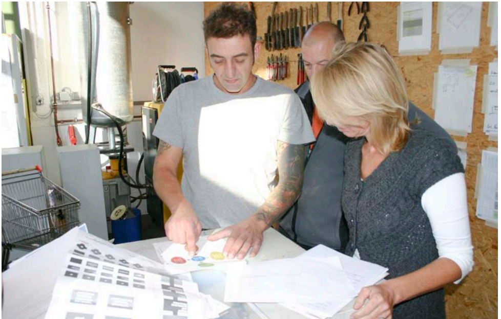
Skizze diente als Ausgangspunkt für die Erstellung des Modells.