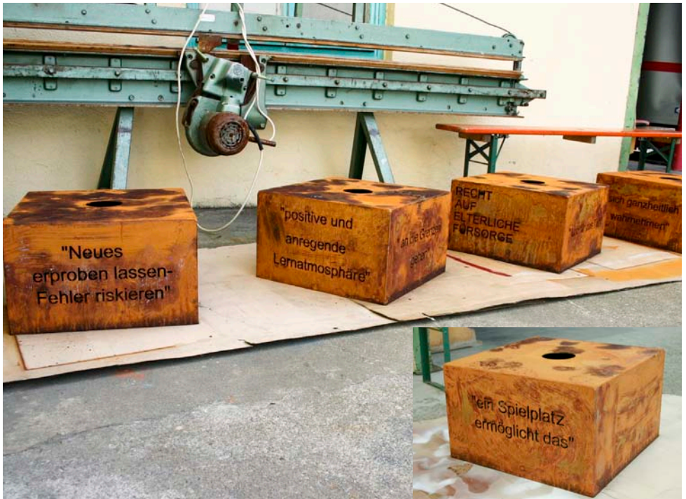
Die Quader liegen nun im Freien und bekommen eine natürliche Rostpatina.