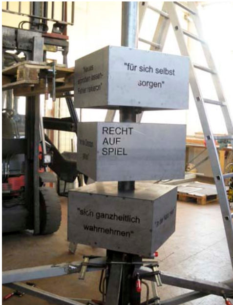
Nummer drei sitzt.