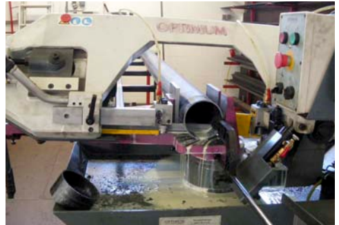
Mit der „großen“ Metallsäge wird das Rohr in die richtige Länge gebracht.