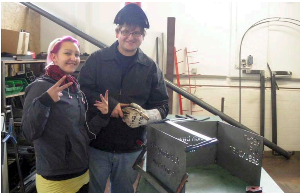
Der Spaß darf beim Werken natürlich nicht fehlen. Vielleicht kann man sogar ein wenig Stolz in den Gesichtern erkennen.