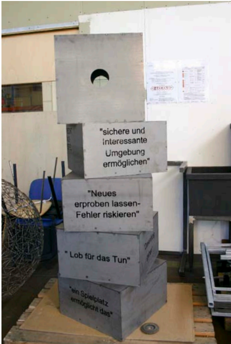
Die fertigen Quader stehen bereit für den Probezusammenbau in der Werkstatt.