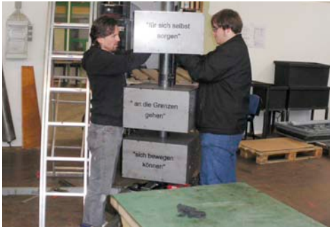
Ein Quader folgt dem anderen.