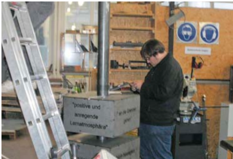
Am Übungsobjekt wird auch bei der Montage mit verschiedenstem Werkzeug gearbeitet.