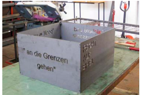
Genaueres Arbeiten ist bei der Verarbeitung von Metall besonders wichtig.