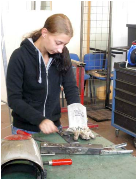
Die Zubehörteile werden ebenso in der Metallwerkstatt nach Maß gefertigt.