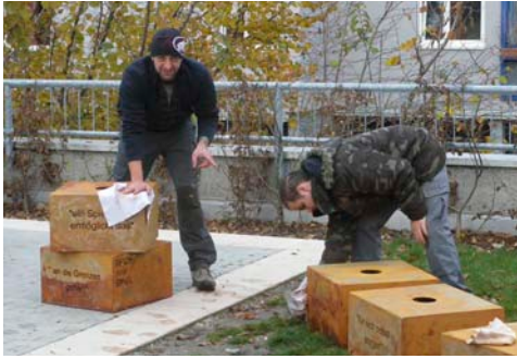
Am 7. November 2011 ist der Aufbau der Kinderrechte-Statue von aqua mühle frastanz...