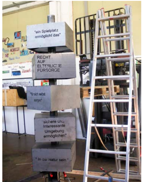
So sieht der fertige Turm aus.