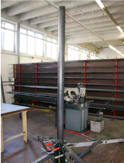
Das Grundgerüst ist aufgebaut.